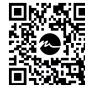
video CLEAN spray video CLEAN spray

Disponibile anche la versione per le industrie alimentari o medicali.