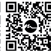
video CLEAN salvietta video CLEAN wipe