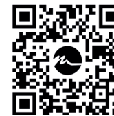
video FIT spray video FIT spray

Disponibile anche la versione per le industrie alimentari o medicali.