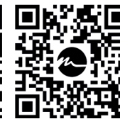
video FIT salvietta video FIT wipe